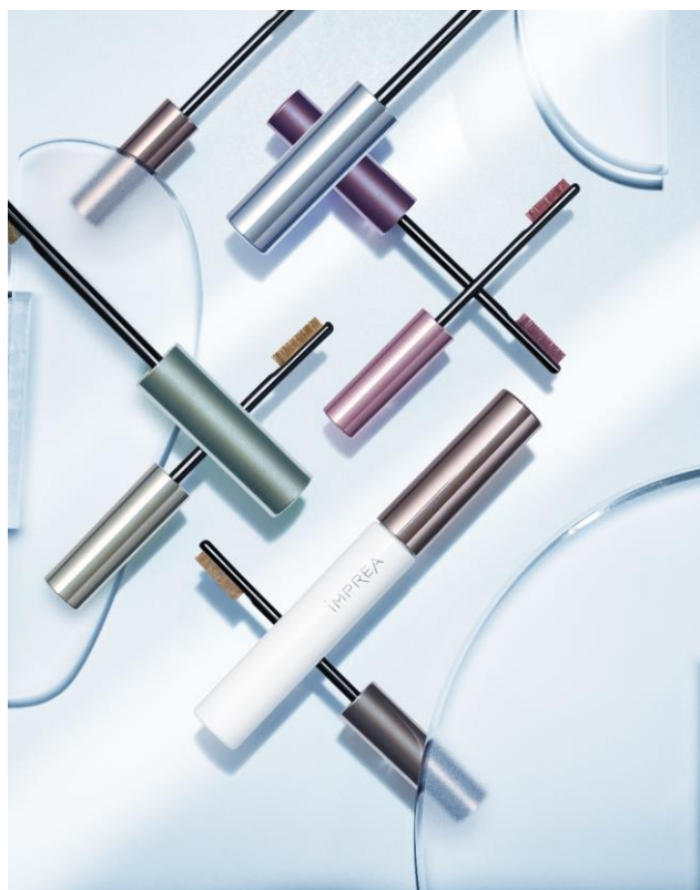
インプレア アイブロウ マスカラによる 「眉」×「髪」の印象プロデュース例

コーセー ミルボン コスメティクス 株式会社(本社:東京都中央区、代表取締役社長:藤原 弘枝)は、美容室専売化粧品ブランド『インプレア』から、ヘアの美容提案とあわせて印象をプロデュースする「インプレア アイブロウ マスカラ」「インプレア アイブロウ ペンシル」などの新製品(5品目 13品種、税抜 500円～3,500円)を2021年3月1日より、全国のインプレア取扱い美容室にて発売します。