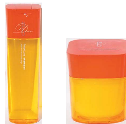
<ディーセス ノイ ドゥーエ フレッシュリユクス>