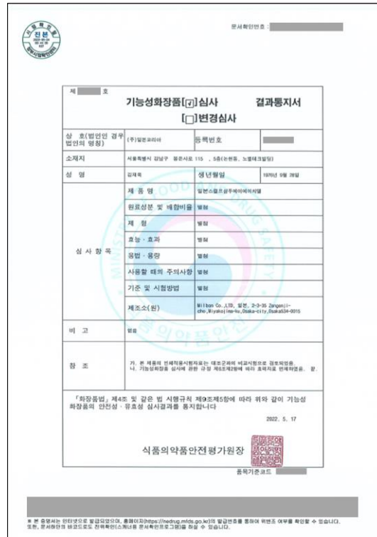
図 2 食品医薬品安全処による機能性化粧品審査結果通知書